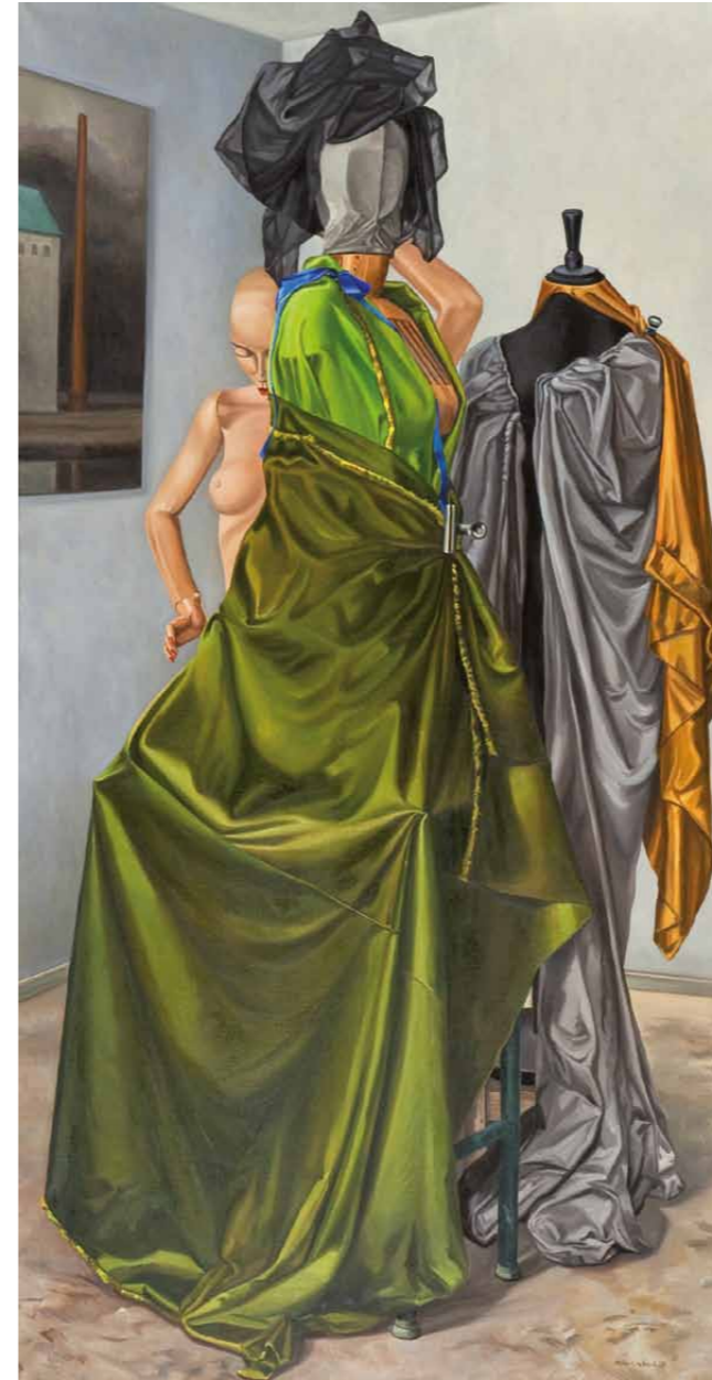
Gruppenbild mit Dame 2009 · Gouache & Öl auf Leinwand · 210 x 110 cm