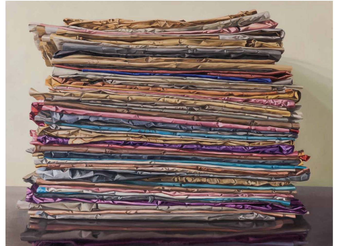
Lob der Ordnung IV 2013 · Gouache & Öl auf Leinwand · 72 x 95 cm