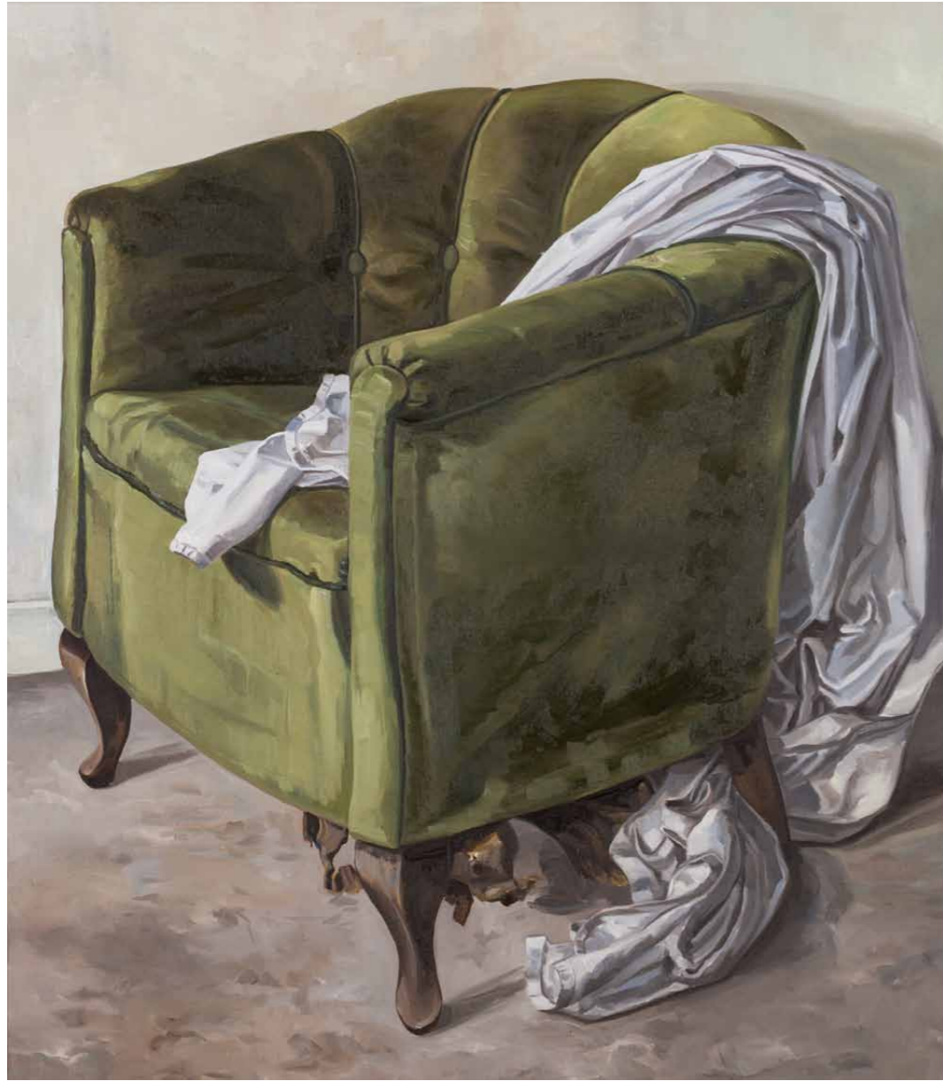
Grüner Sessel II 2011 · Öl auf Leinwand · 98 x 85 cm