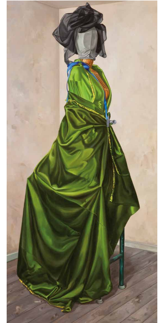
Grüne Dame 2010 · Gouache & Öl auf Leinwand · 210 x 100 cm