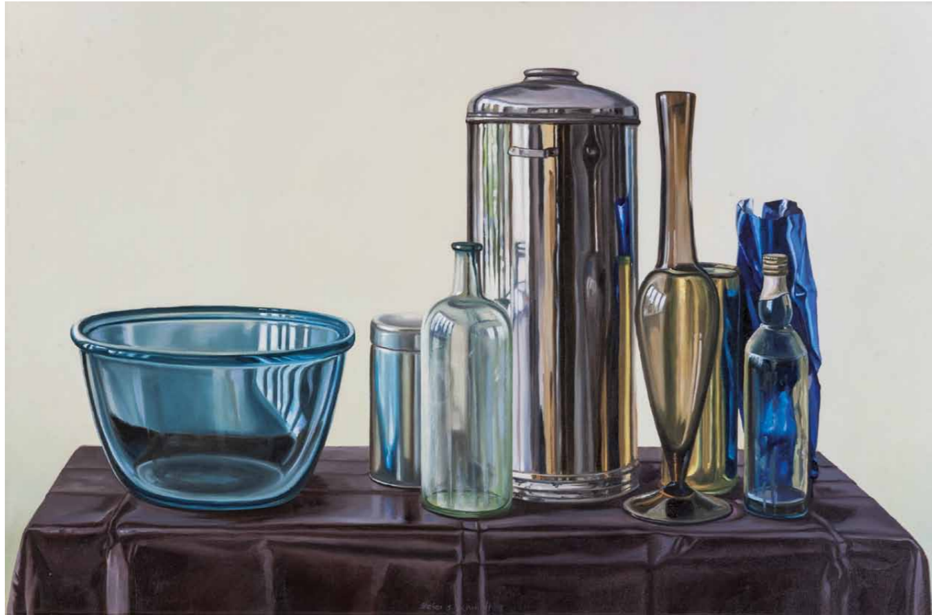
Spiegelungen 2009 · Öl auf Leinwand · 60 x 90 cm