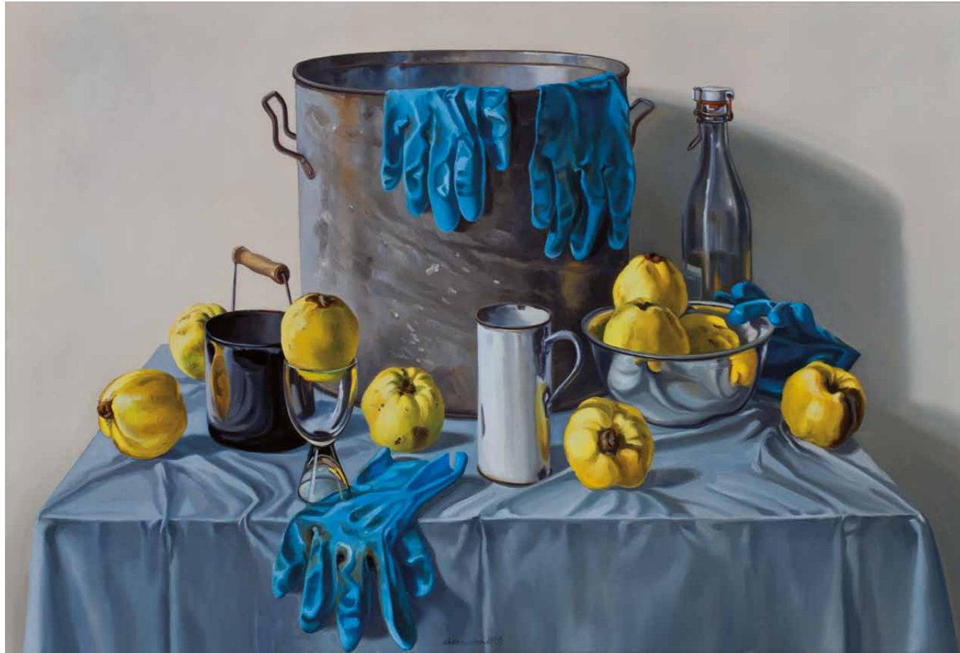
Stilleben mit Quitten und Gummihandschuhen 2009 · Öl auf Leinwand · 65 x 95 cm