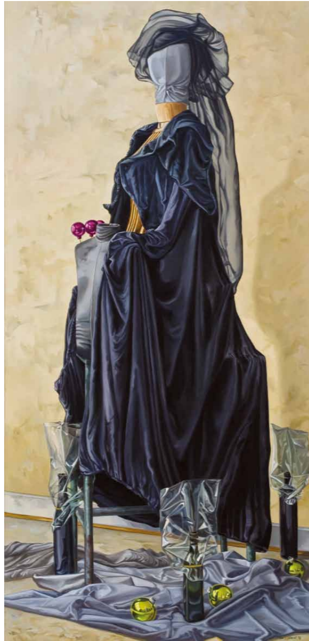
Besuch der schwarzen Dame 2008 · Öl auf Leinwand · 210 x 100 cm