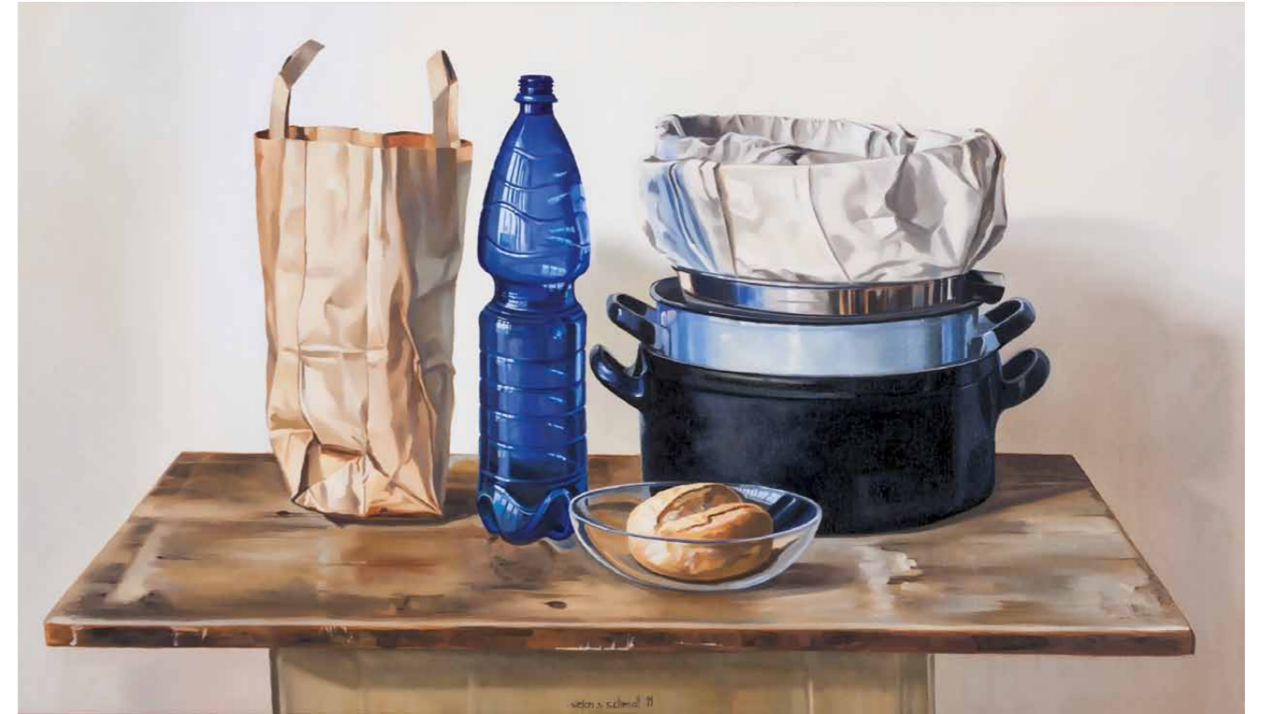
Stilleben mit blauer Mineralwasserflasche 2011 · Öl auf Leinwand · 55 x 95 cm