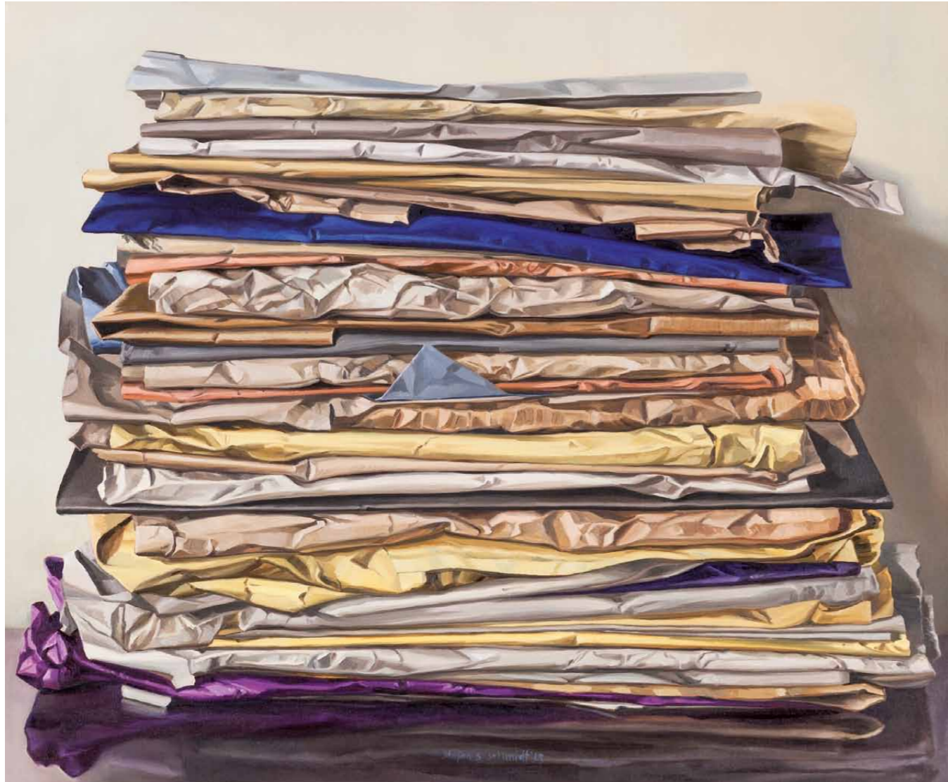
Lob der Ordnung II 2013 · Öl auf Leinwand · 61 x 75 cm