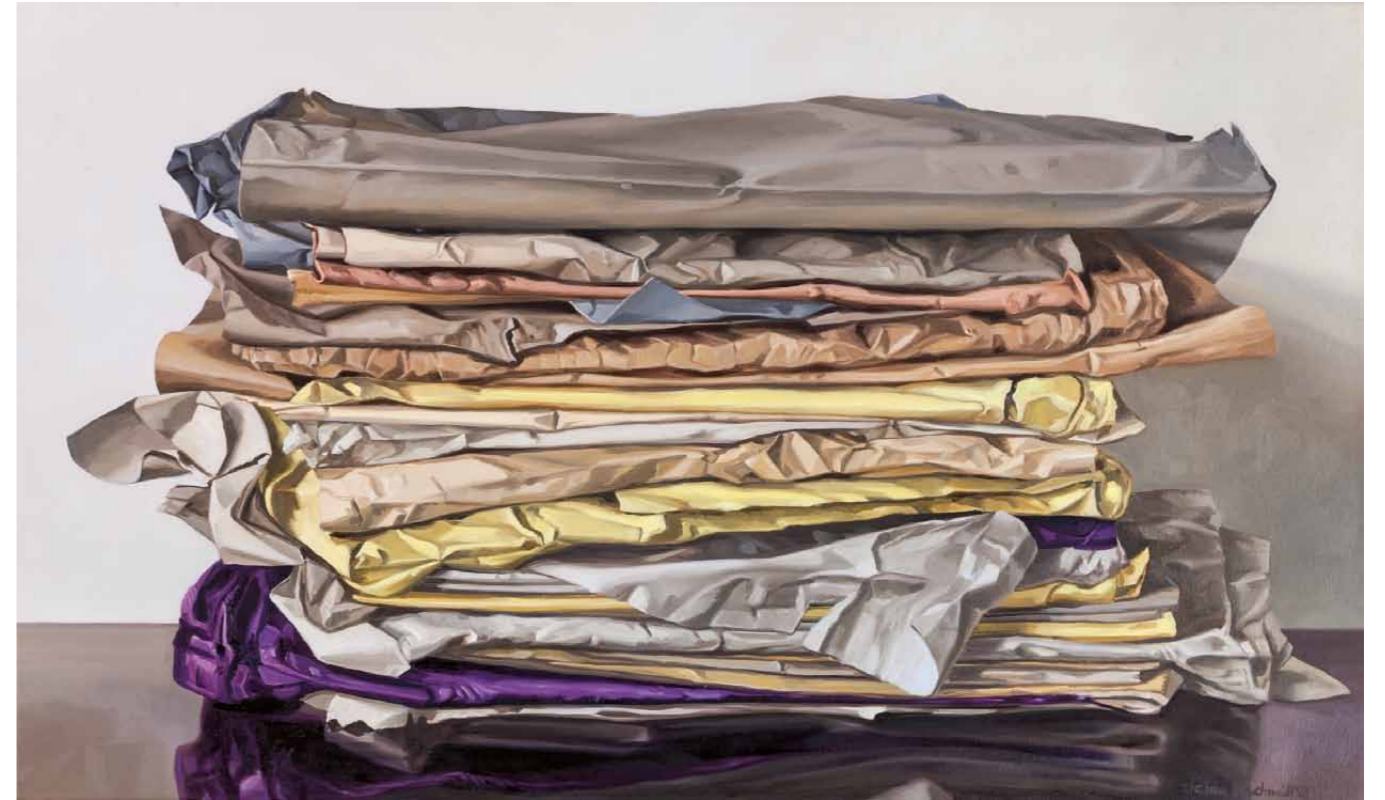
Lob der Ordnung I 2013 · Öl auf Leinwand · 55 x 92 cm