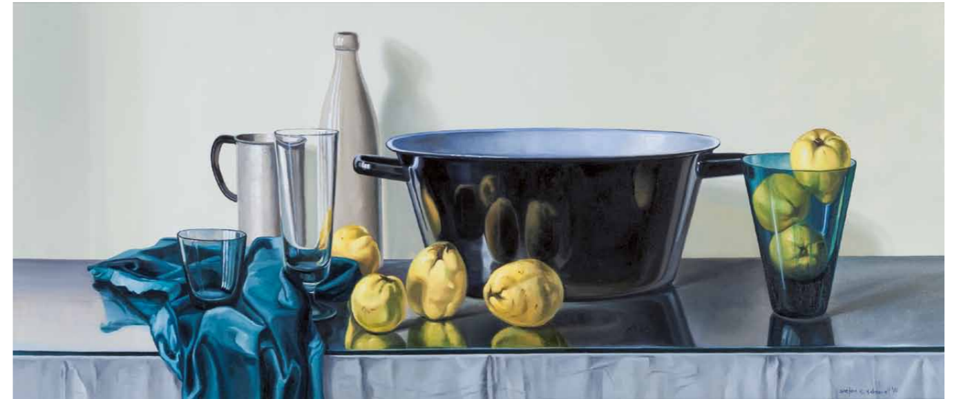
Stilleben mit Quitten und schwarzer Schüssel

2014 · Gouache & Öl auf Leinwand · 50 x 105 cm