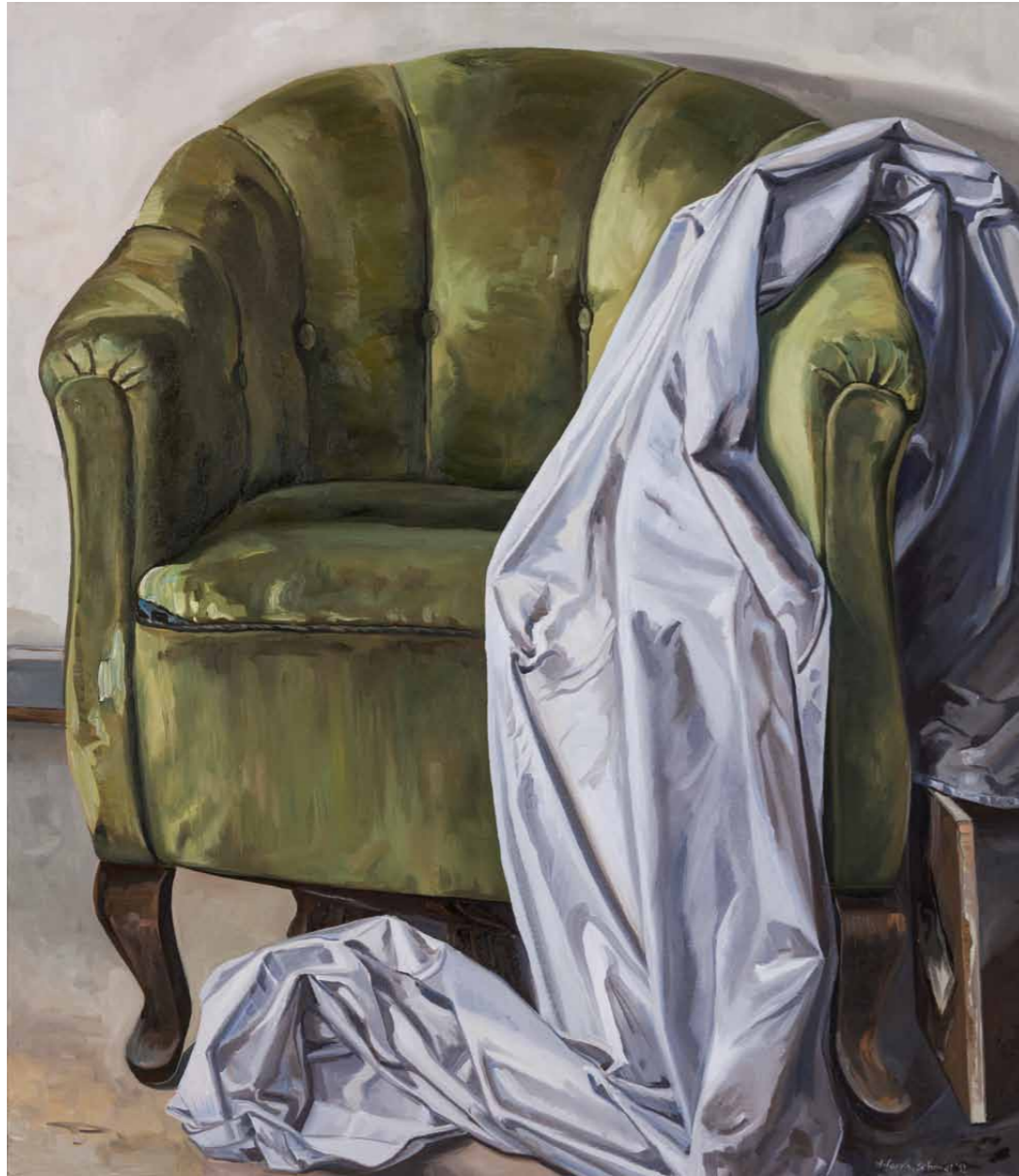
Grüner Sessel II