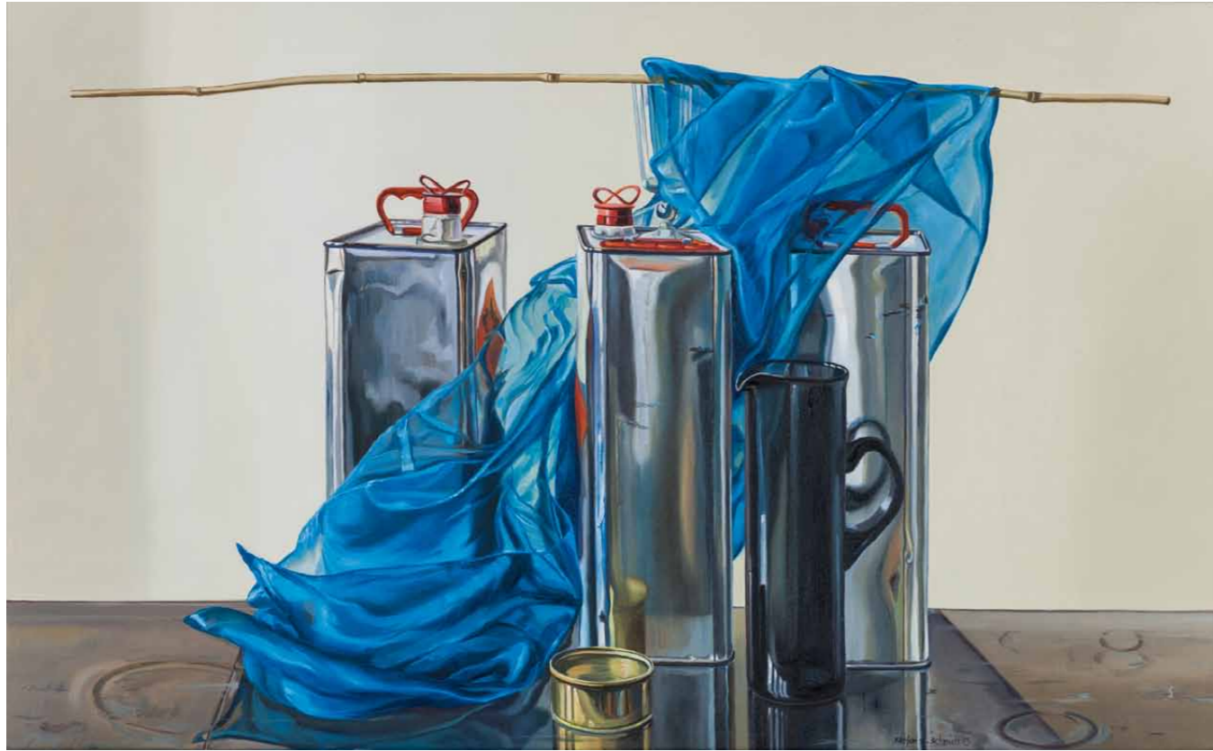
Drei Kanister 2013 · Öl auf Leinwand · 65 x 105 cm