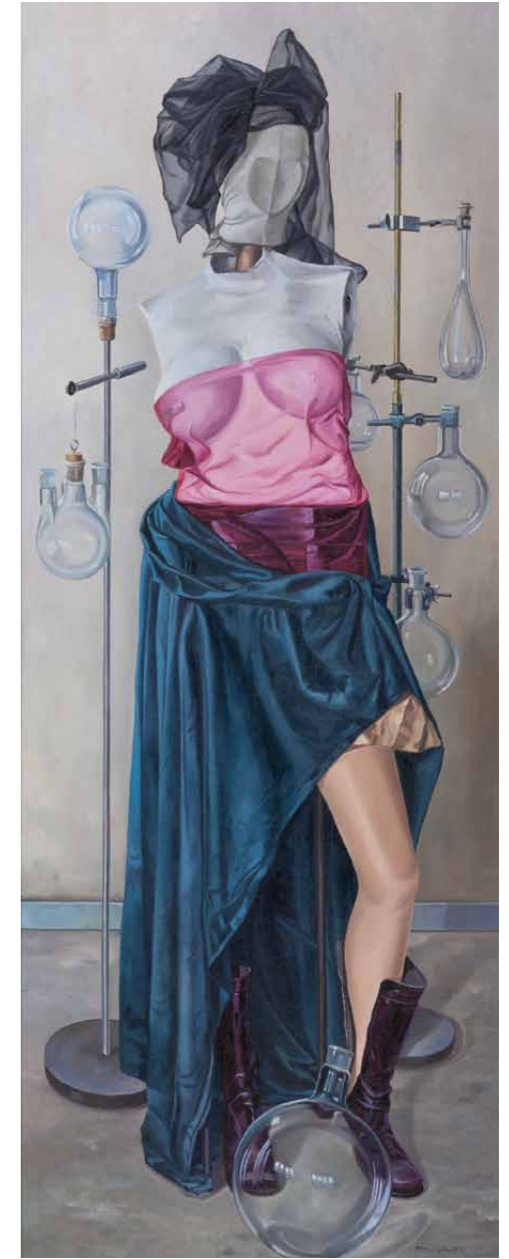
Louise 2011 · Gouache & Öl auf Leinwand · 210 x 80 cm