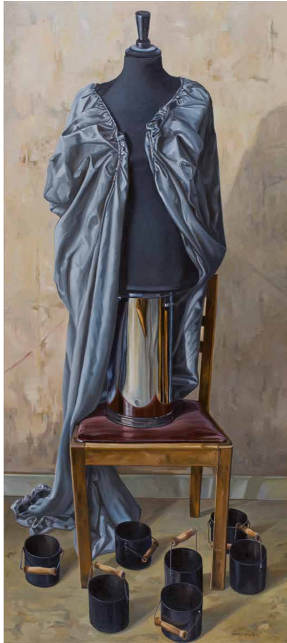
Märchenstunde 2009 · Gouache & Öl auf Leinwand · 180 x 80 cm