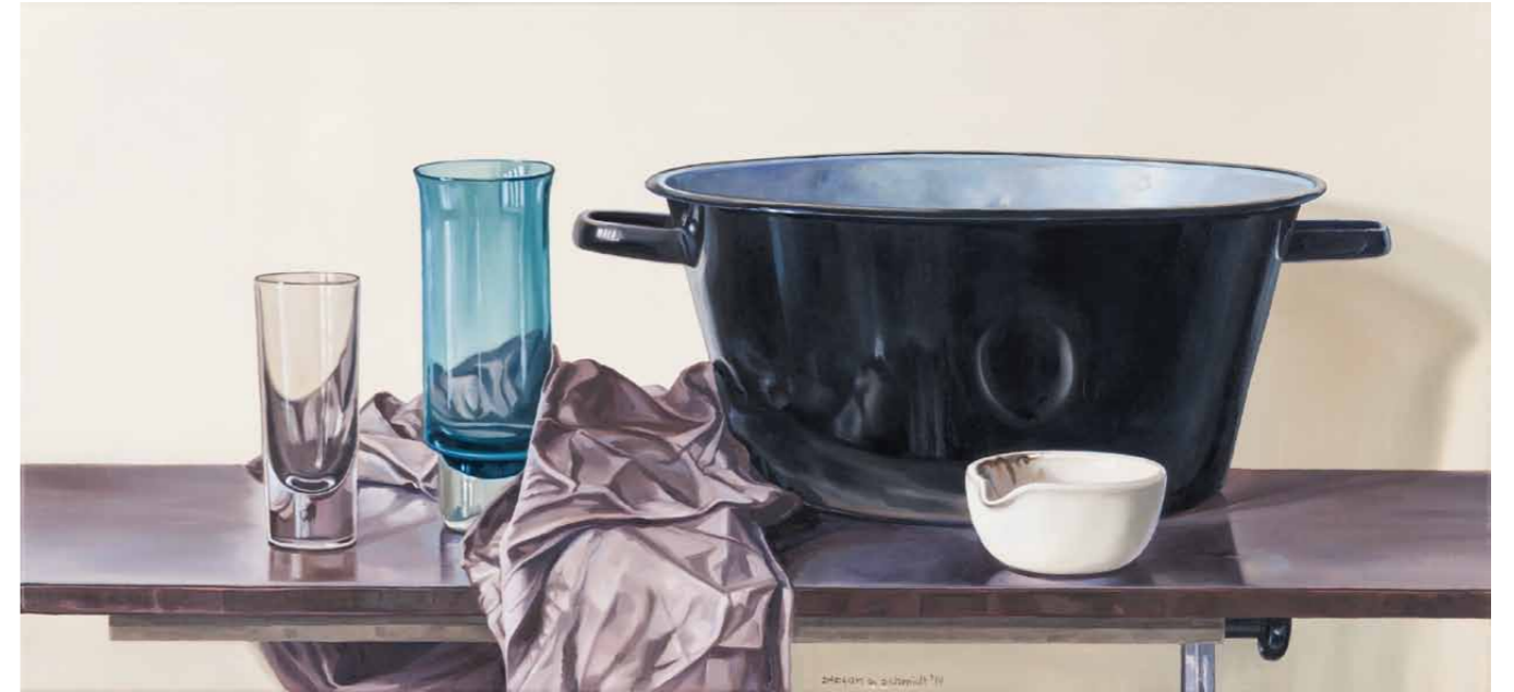
Stilleben mit schwarzer Schüssel 2014 · Öl auf Leinwand · 40 x 85 cm