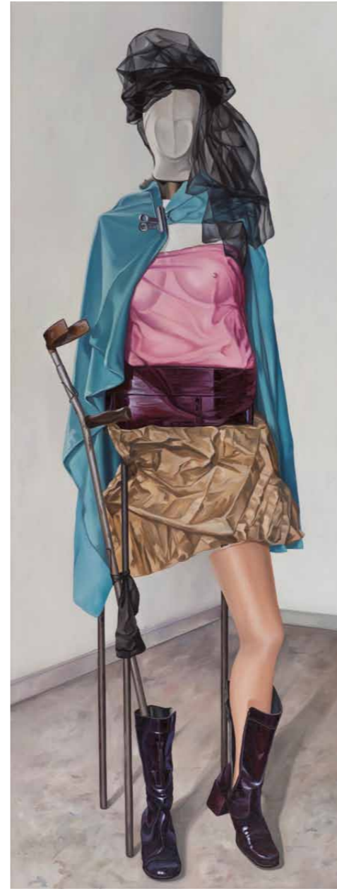
Junge Dame 2010 · Gouache & Öl auf Leinwand · 210 x 80 cm