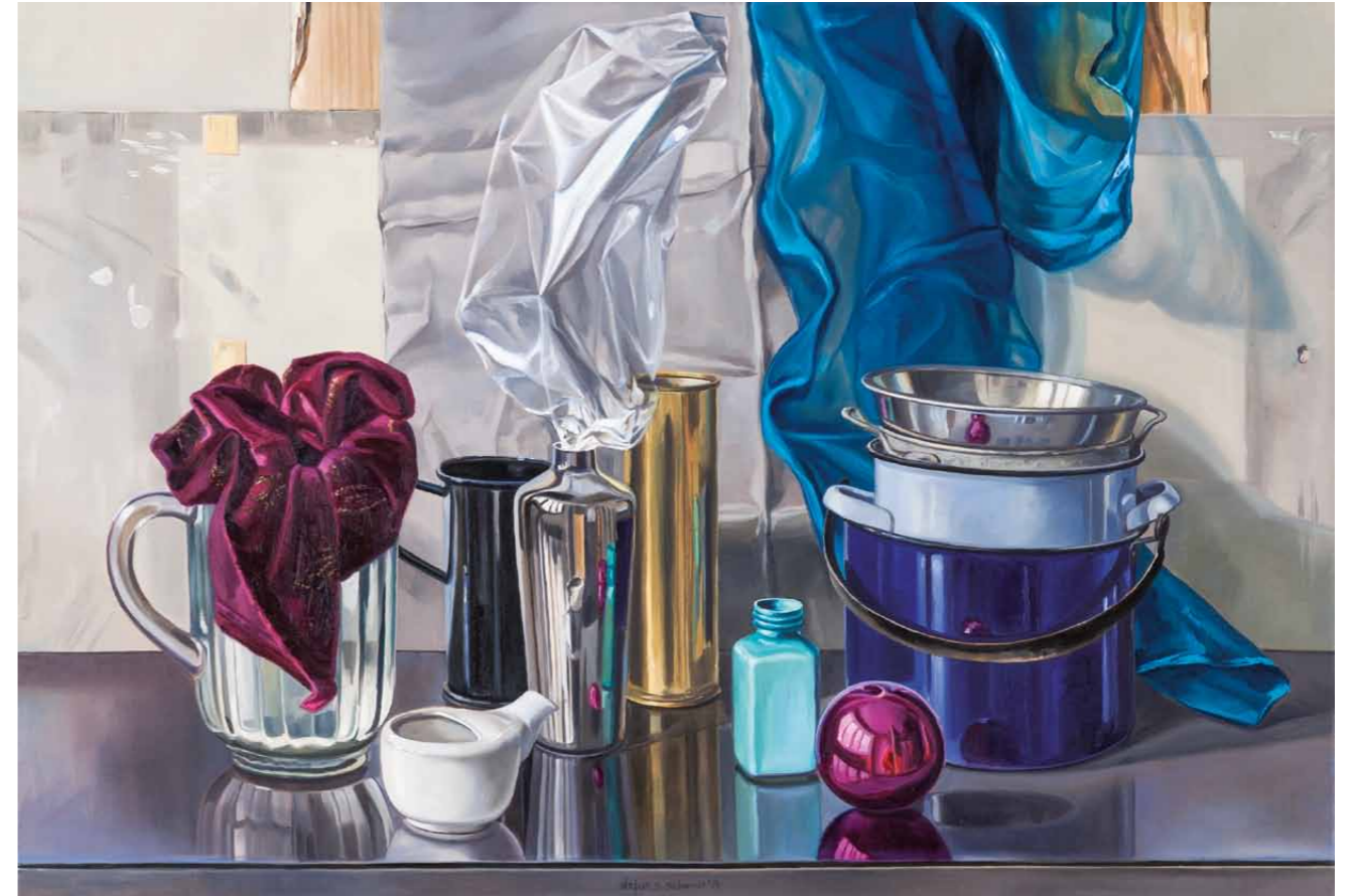
Fahrendes Volk 2014 · Öl auf Leinwand · 65 x 95 cm