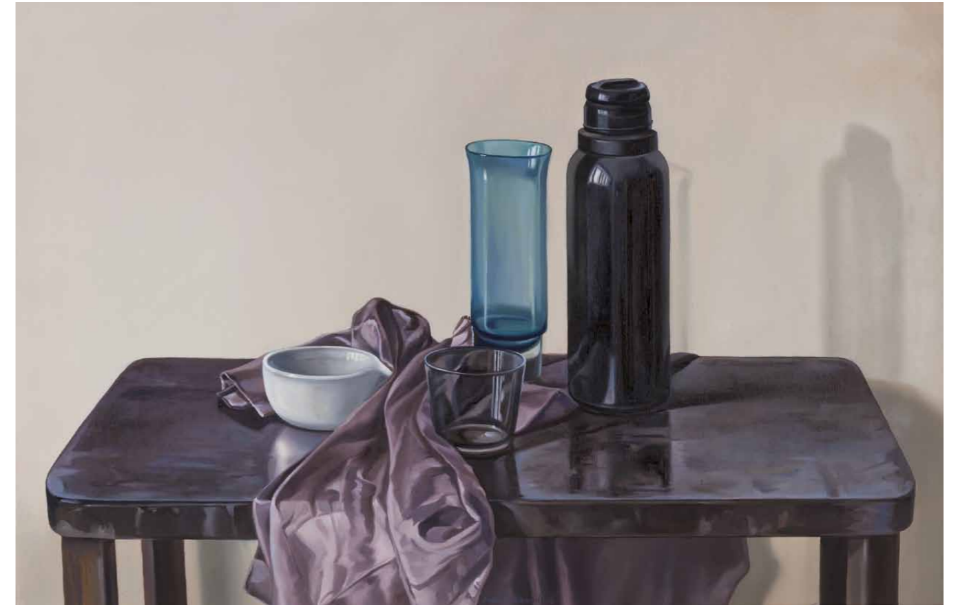
Stilleben mit blauem Glas

In einer extrem beschleunigten, dauerreizüberfluteten Welt der schnellen Bilder muss dies zwangsläufig anachronistisch erscheinen, wenn nicht gar subversiv; vielleicht aber auch notwendig, damit der Mensch sich nicht verliert.