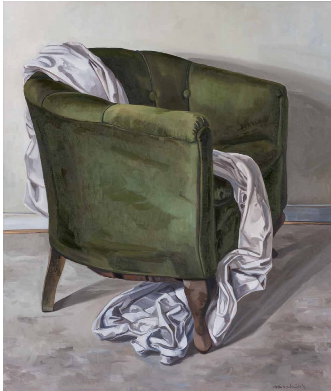
Grüner Sessel IV 2013 · Öl auf Leinwand · 100 x 85 cm