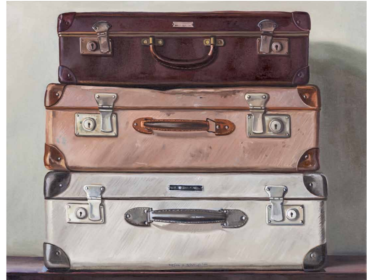
Kleiner Kofferstapel 2011 · Öl auf Leinwand · 50 x 65 cm