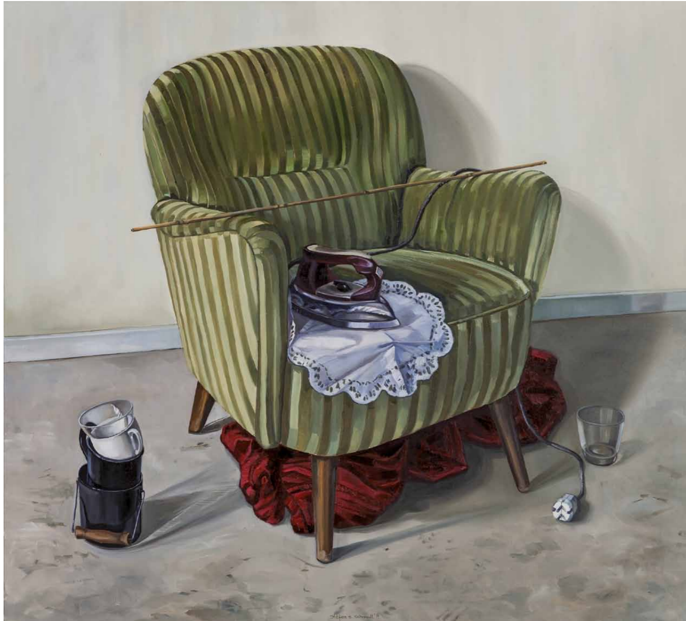
„Die wilden 60er“ 2014 · Öl auf Leinwand · 100 x 110 cm